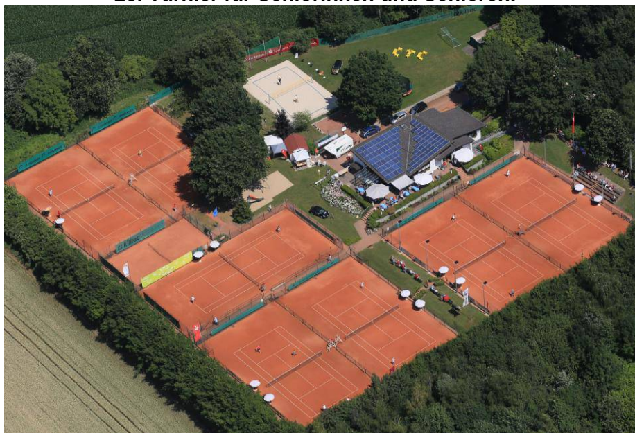
Die schöne Tennisanlage des CTC

Liebe Tennisfreunde, herzlich willkommen in der Samt- und Seidenstadt zum 28. Turnier für Seniorinnen und Senioren.